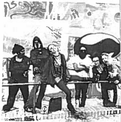
SORRISI I ragazzi che hanno dipinto, insieme a dei «maestri» fiorentini il circolo di Staggia