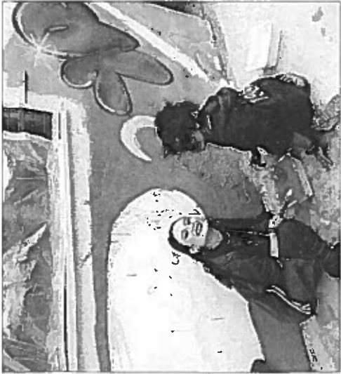
Nuovo volto Cambio di look al circolo grazie ai ragazzi del progetto

Per questo a Staggia abbiamo scommesso sulla loro creatività e