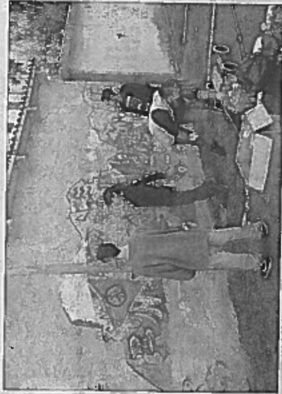
Al lavoro All'inizio i ragazzi coinvolti erano quattro ma in breve sono diventati una ventina e hanno sperimentato il piacere del "fare insieme"

Il progetto ha una doppia valenza: ha permesso di riqualificare un muro imbrattato da scritte offensive coinvolgendo i giovani rappresentando anche un impegno importante, in chiave sociale e culturale: "Per il murales - continua Ceccherini - è stato