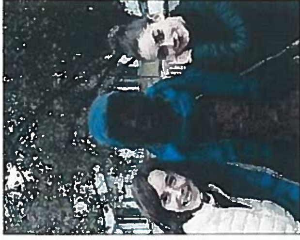
Fondazione Territori Sociali Altavaldelsa. Il nuovo servizio di Educativa di strada partirà ufficialmente lunedì 30 novembre. Sono stati attivati anche due profili social