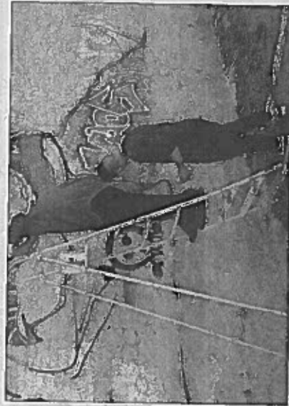
li ma ci hanno messo a disposizione un garage per riporre tutto il materiale utilizzato per dipingere". Durante il laboratorio i ragazzi sono

individuata la parete di fronte all'ingresso principale della piscina comunale-nel parcheggio La Buca. Il progetto è stato possibile grazie alla